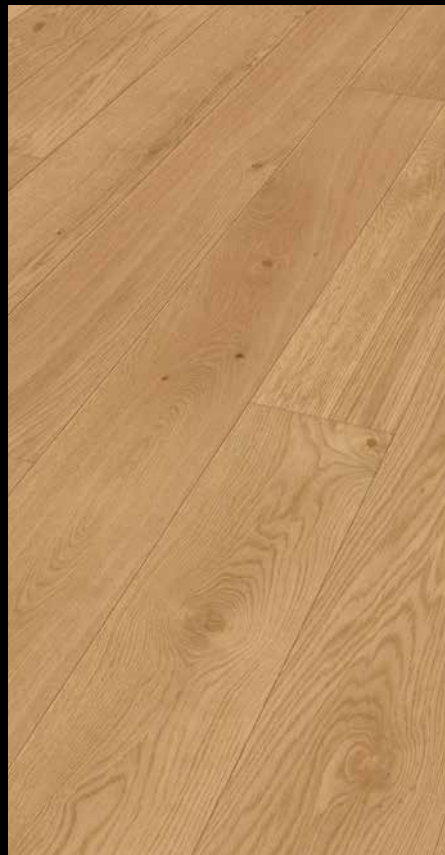
Eiche lebhaft pure 8936 / gebürstet