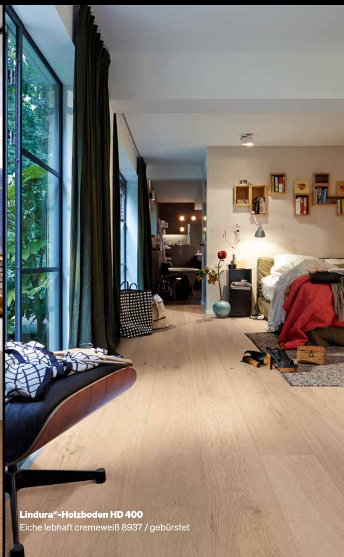
Lindura®-Holzboden HD 400 Eiche lebhaft cremeweiß 8937 / gebürstet