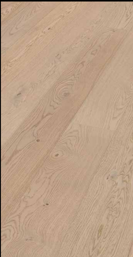
Eiche lebhaft cremeweiß 8937 / gebürstet