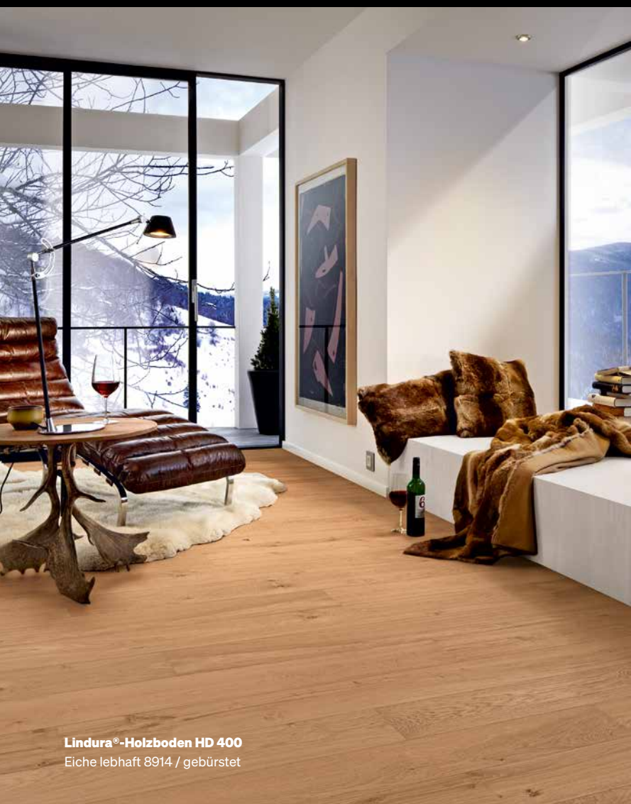
Lindura®-Holzboden HD 400 Eiche lebhaft 8914 / gebürstet

Nachhaltig. Robust. Alltagstauglich. Das ist Lindura-Holzboden. Und genau das macht diesen Boden zum Holzboden der Zukunft. Für die Herstellung der Echtholzdeckschicht benötigen wir nur ca. 1/8 so viel Holz wie bei einem herkömmlichen Mehrschicht-Parkettboden. Wie das geht? Ganz einfach: Mit einem innovativen Herstellungsverfahren! Die sogenannte Wood-Powder-Technologie sorgt dafür, dass die ressourcenschonende Echtholzdeckschicht extra eindruckstabil wird. Wood Powder ist eine feine Materialmischung aus Holzfasern, mineralischen Bestandteilen und weiteren Zusatzstoffen. Sie wird mit der HDF-Mittellage und der Deckschicht fest verpresst – eine stabile Verbindung für einen absolut alltagstauglichen Holzboden!