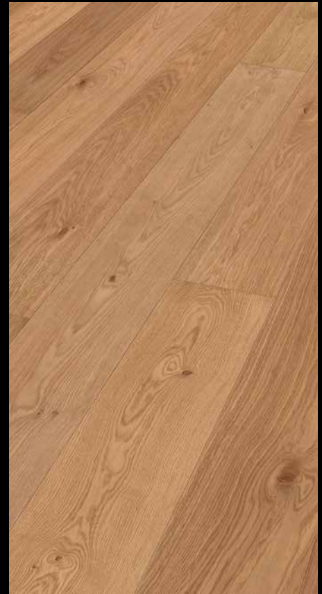
Eiche lebhaft 8914 / gebürstet