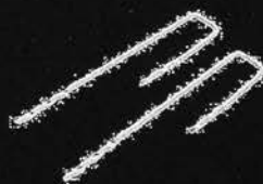
GRS Befestigungshaken Ø 4 mm, 100 Stück je Box

Bei evtl. Verkleben von Qualitäten mit Drainage-Ausrüstung beachten Sie, dass geeignete Outdoor-Kleber verwendet werden und die Drainage-Wirkung erhalten bleibt, d. h. zum Beispiel die Drainage-Ausrüstung darf nicht „satt“ im Kleberbett liegen.