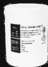
GRS wetterfester Kunstrasen- klebstoff, 4 kg Plastikeimer