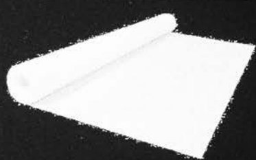
GRS Ausgleichsvlies - 50 m x 2,10 m Verhindert das Durchwachsen von Pflanzen